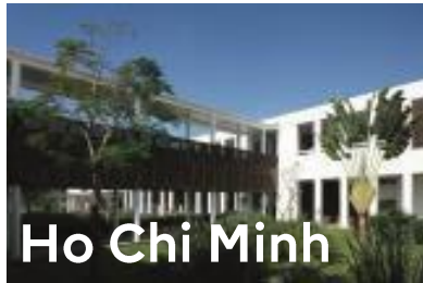
Ho Chi Minh