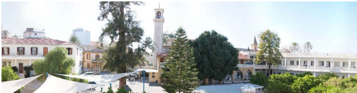
L'école vue du 2e étage