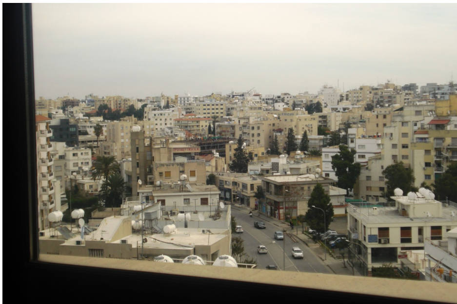
Vue plongeante sur la capitale, du bureau de Nicosie © Désirée Birinci 4e

L'impartialité, une valeur qui distingue l'AFP dans le trio de tête des agences de presse internationales. Avec des atouts rien